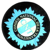
Mme Fanta CONTE